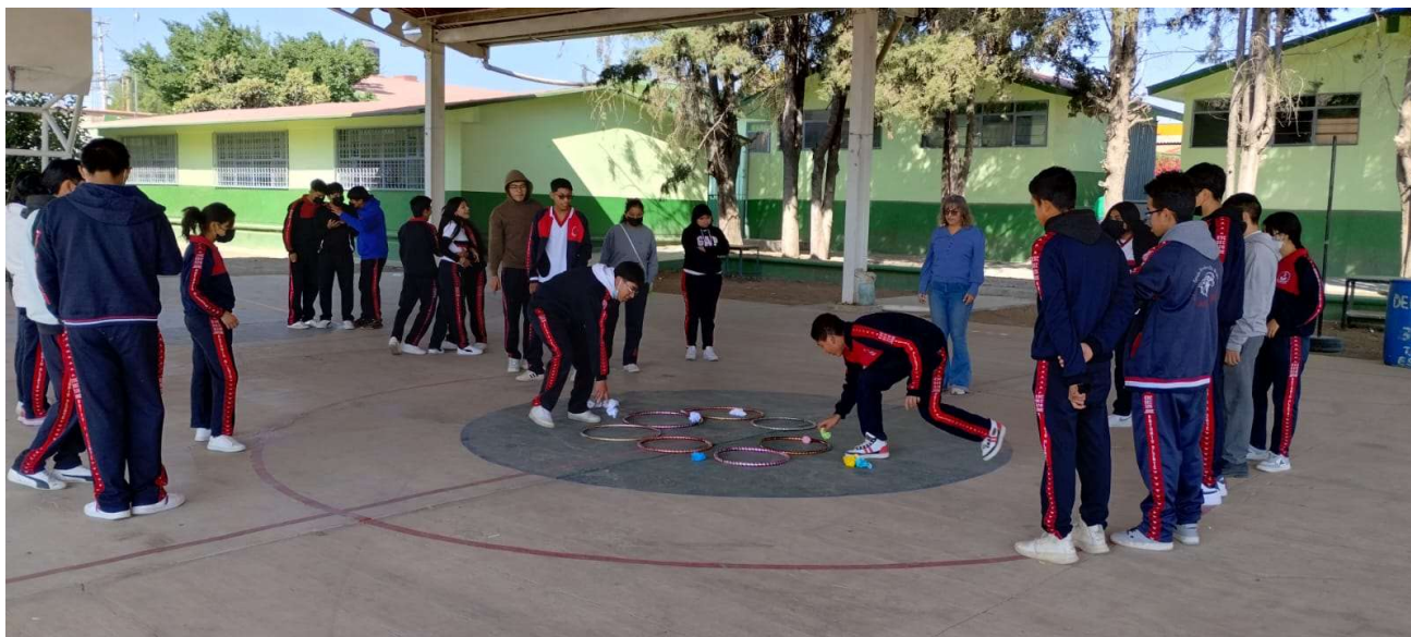
Imagen 2: Sesión 1 de trabajo de taller de fortalecimiento socioemocional