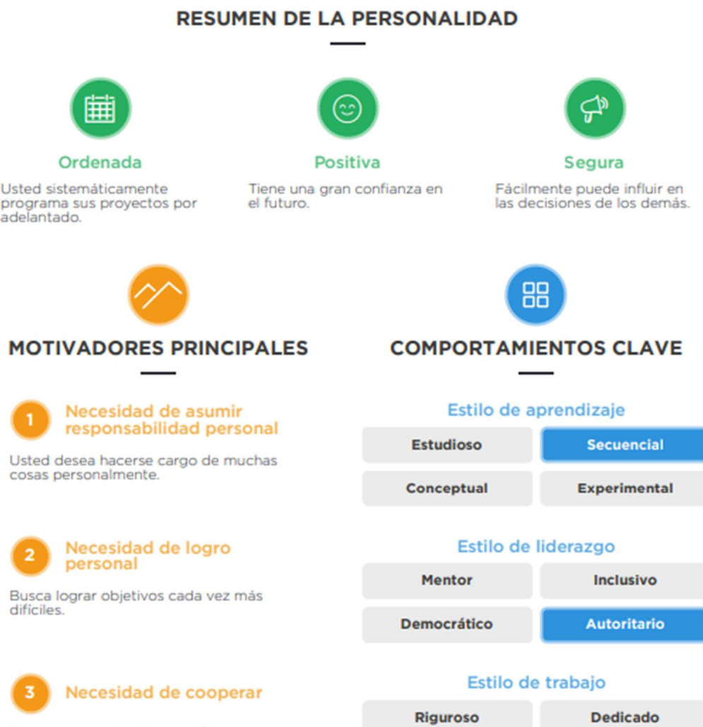
Figura 1: Resumen de cuestionario MyPrint. Reporte MyPrint, 2024)

que se trabajaron se muestra en la imagen 1, a cada alumno se le aplico una prueba y de cada uno se obtuvo un reporte similar.