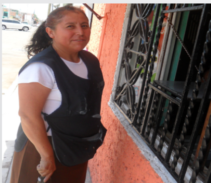
Ilustración 7. Actitud de trabajadora de IME "D" de Irapuato.

Encuestar permitió considerar como algunos trabajadores se liberaron con la misma, ya que agregaron comentarios no solicitados pero de su iniciativa como: - Me gustó esta encuesta_ o _ Esta encuesta está muy bien_. Platicar con ellos hizo comprender porque algunos no quisieron contestar y este fue por ejemplo un comentario_ Es que en 12 minutos uno saca una pieza por minuto, lo que nos interesa es sacar la producción y bien hecha; si la operación no es sencilla sacamos cuando menos 2 piezas por minuto_. Todos los comentarios fueron muy motivantes y sumamente valiosos ya que la primera suposición que nos formulamos es que no contestan por temor a represalias; pero no es así, el motivo es el ingreso y el compromiso con su trabajo.