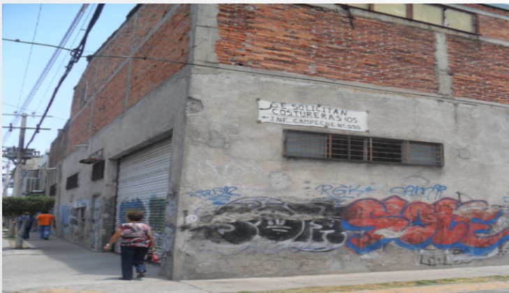
Ilustración 8. Nave de producción de Maquila de exportación en Irapuato.

Las características que en general prevalecen en la industria del vestido son: Cadena productiva controlada por intermediarios comerciales, fabricación de productos básicos, tecnología sencilla, la edad promedio del personal obrero es de 22.4 años, mano de obra no calificada, alta especialización, organiza la producción bajo estructuras verticales, bajos costos de producción, líneas de producción mecanizadas, no poseen fábricas e instalaciones para producir; ya que manejan una red global de proveedores para trasladar las actividades de ensamble y confección y pocas restricciones gubernamentales para moverse entre diversos países.