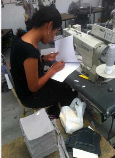
Ilustración 4. Trabajadora de IME en Irapuato contestando la encuesta de esta investigación.

La altura y características del mueble de la máquina de coser industrial requieren persona de estatura pequeña para que sus piernas no se encojan. La propietaria permitió encuestar y tomar fotografía en marzo 2013.