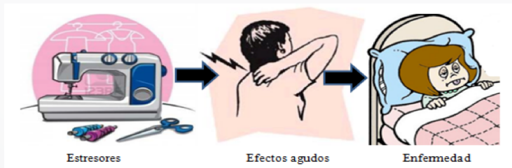
Ilustración 9. Relación factores psicosociales de riesgo o estresores y salud en la maquila textil del vestido.

Los factores psicosociales de riesgo, también llamados estresores producen reacciones físicas o mentales que influyen en la salud del trabajador que repercuten en accidentes de trabajo, ausentismo, satisfacción laboral y rendimiento. Elaboración propia. Imágenes recuperadas de www.google.com