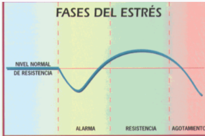
Ilustración 10. Fases sintomáticas del estrés.

Aun cuando la voz de alarma prepara al organismo para una mejor resistencia si esta se prolonga la persona pasa a la improductiva fase del agotamiento. Gráfico Reimpreso. Fuente: (Melgosa, 2000).