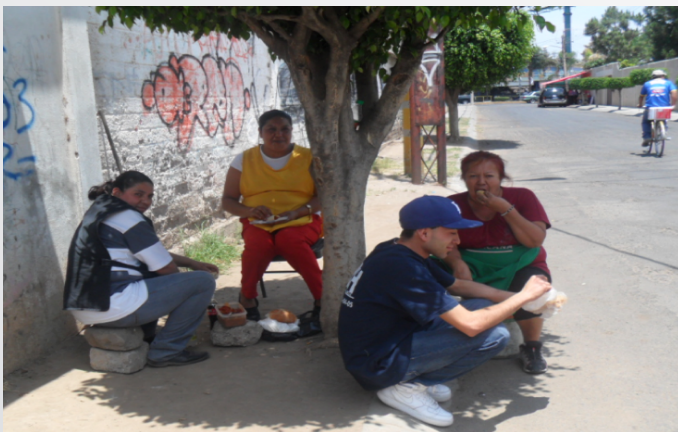
Ilustración 6. Trabajadores de IME "A" de Irapuato en receso.

Aproximadamente a partir de la primera década de este siglo XXI, se ha comenzado a utilizar este término de gran importancia conceptual: Los riesgos psicosociales; para referirse a una serie de situaciones de gran peso en la vida laboral que pueden afectar gravemente la salud de los trabajadores.