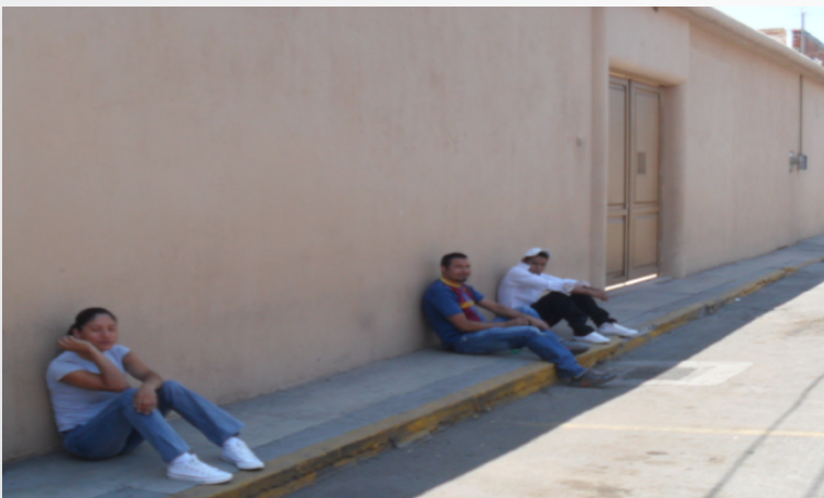
Ilustración 1. Fachada de Industria Maquiladora de Exportación (IME), en Irapuato.

De manera efectiva se observa en esta industria la participación de personas de ambos sexos, en rango de edad de 18 a 56 años con la intención de aportar un ingreso que beneficie de manera directa la economía de su hogar.