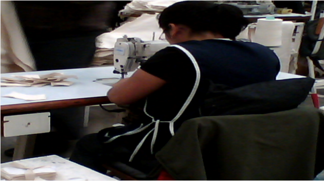
Ilustración 5. Posición forzada en la Industria Maquiladora de Exportación de Irapuato.

La Salud Laboral se refiere el estado o las circunstancias de seguridad física, mental y social en que se encuentran los trabajadores en sus puestos de trabajo.